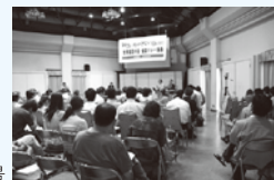
(写真) 昨年集会風景

終了後、交流会を行います。パネラーの方々、在日難民の方と直接お話ができますので、お気軽にご参加ください。