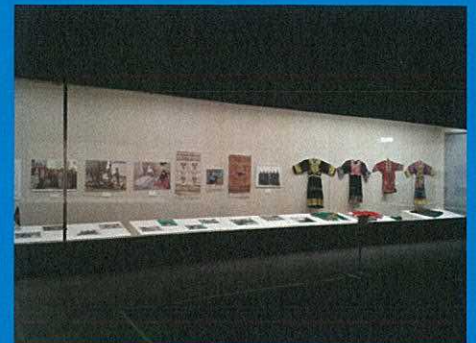
アフガン孤児支援・ ラーラ会の展示