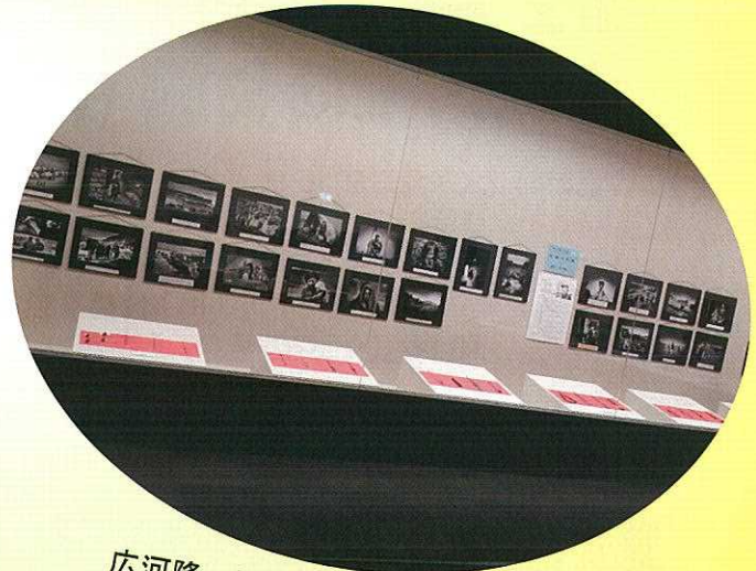
広河隆一写真展「空爆の爪痕」