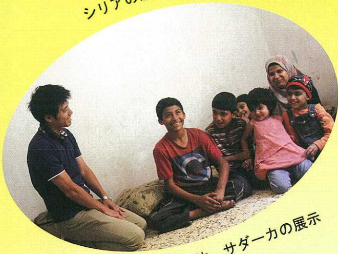
シリア支援団体 サダーカの展示