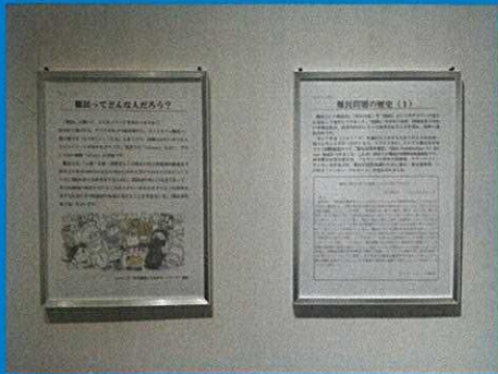
ギャラリーの展示