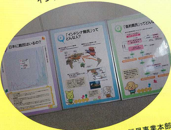
公益財団法人アジア教育福祉財団 難民事業本部提供